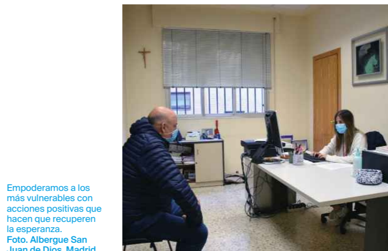
Empoderamos a los más vulnerables con acciones positivas que hacen que recuperen la esperanza.