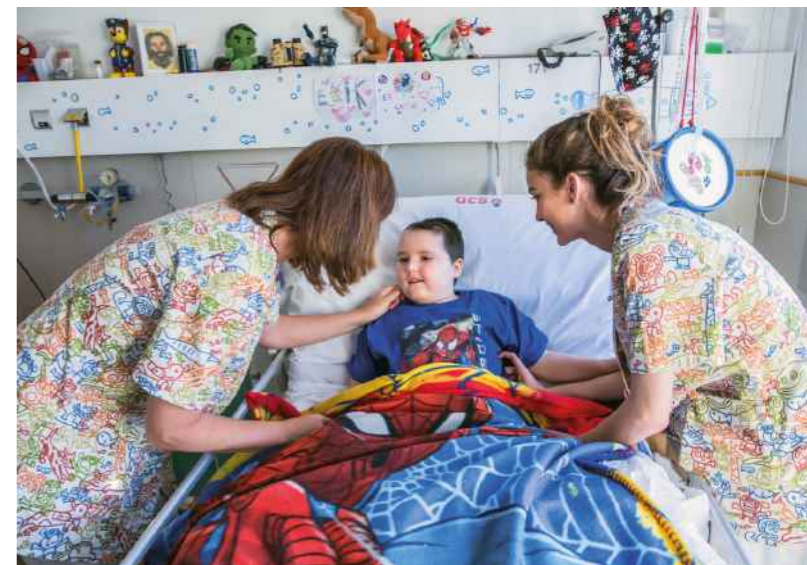
Siempre al lado del que sufre para aliviar y acompañar.