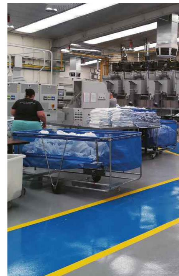
Damos oportunidades a los que no las tienen para que se sientan útiles.